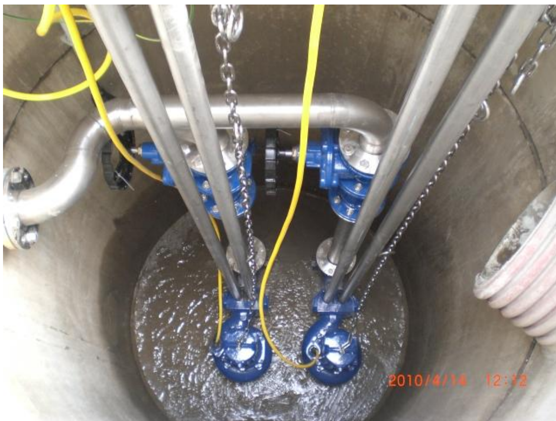
vystrojení mělké areálové čerpací stanice splaškových vod s čerpadly Hidrostral

Koncepci tlakové přípojky a detailní stavební i technologické řešení čerpací stanice (ČS) na areálové kanalizaci nebo domovní čerpací jímky (DČJ) připojované vnitřní kanalizace jednotlivé budovy je nutno vždy předem projednat s provozovatelem. Toto platí zejména pro napojení infrastruktury občanské vybavenosti, kde je nutno zajistit vzhledem k charakteru užívání materiálový a technologický standard srovnatelný s úrovní objektů stanic na kanalizační síti pro veřejnou potřebu. Bude-li provoz zajišťovat provozovatel kanalizace pro veřejnou potřebu, potom je paušálně požadován i přenos provozních údajů na vodohospodářský dispečink provozovatele a předání obvyklé provozní dokumentace včetně provozního řádu ČS nebo DČJ. Při předání do provozu bude provedeno komplexní odzkoušení a bude sepsán protokol o zkoušce funkčnosti čerpadel a rozvaděče.