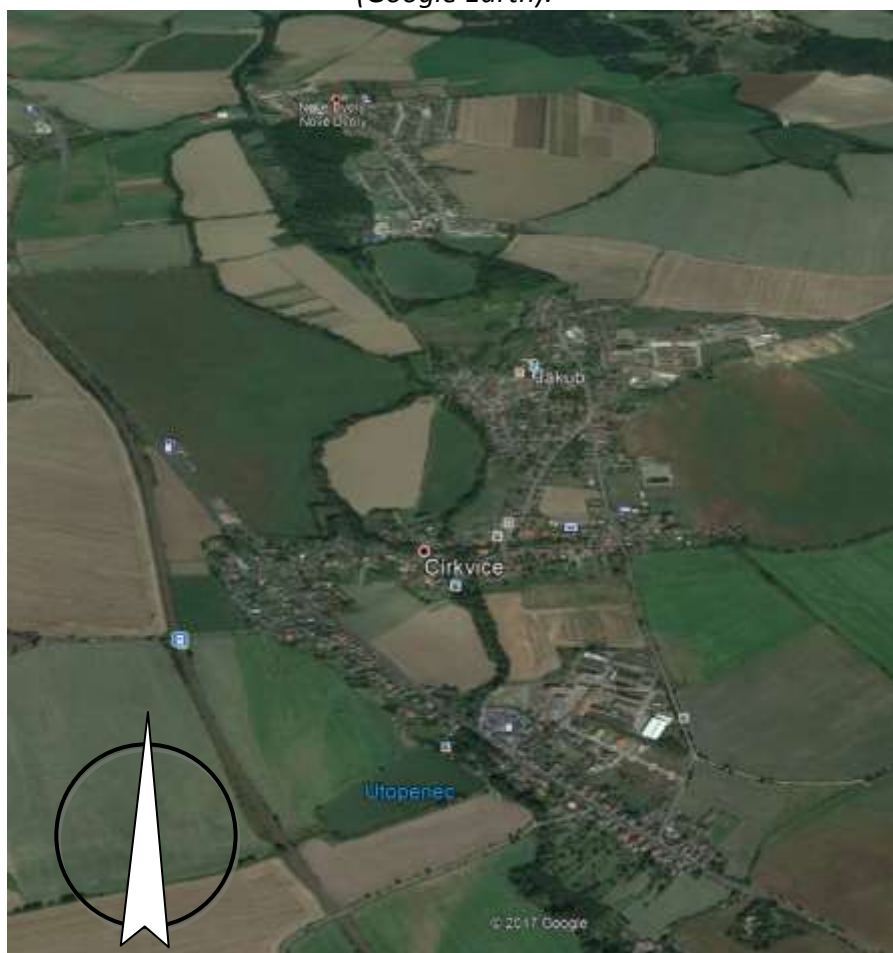
Obr.1. Přehledná situace obce Církvice a městyse Nové Dvory. (Google Earth).

Zástavba v zájmových obcích je tvořena převážně rodinnými domy, z části adaptovanými zemědělskými usedlostmi, ve kterých sídlí asi 95% populace, zbývající obyvatelé jsou soustředěni v historických objektech nebo bytových domech v centru městyse Nové Dvory nebo v bývalých zemědělských vícepodlažních objektech.